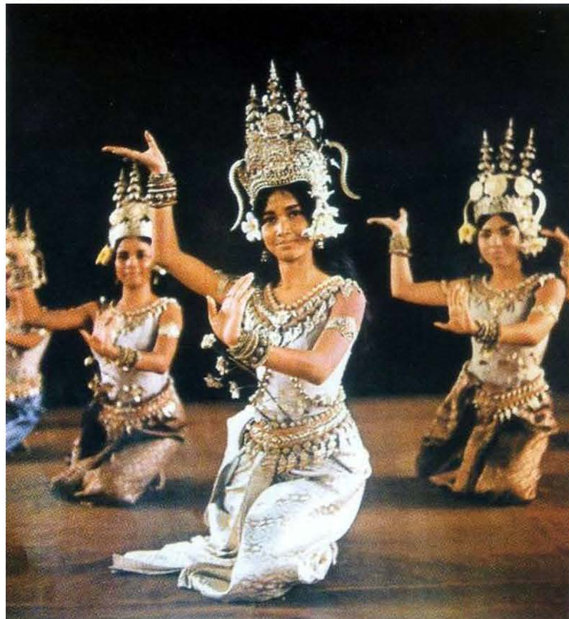
ម្ចាស់ក្សត្រី នរោត្តម បុប្ផាទេវី