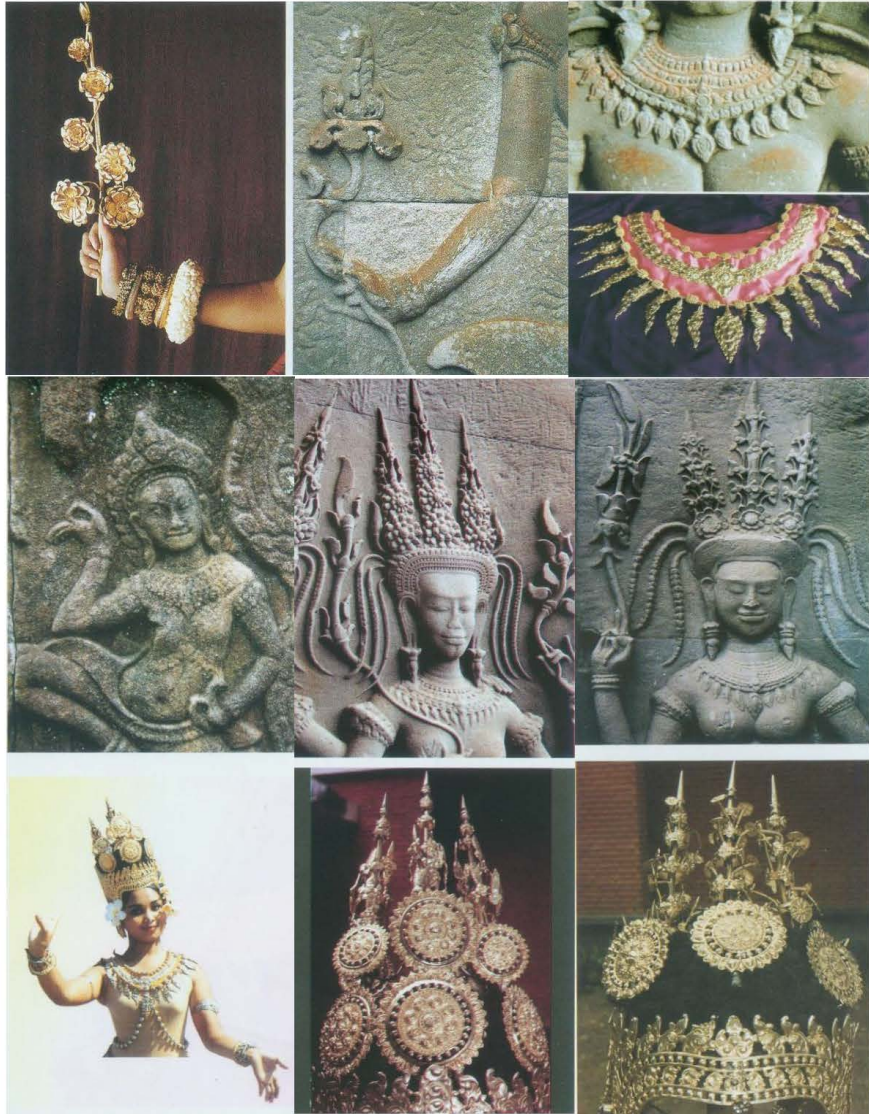
សម្លៀកបំពាក់ គ្រឿងអលង្ការ និងកាយវិការរាំក្នុងរបាំអប្សរដែលយកតាមលំនាំ ចម្លាក់អប្សរ (រូបភាពពីសៀវភៅ «របាំអប្សរ» ដោយអ្នកត្រូវកែវ ណារុំ និង ព្រំ ស៊ីសាផាន្ទា ឆ្នាំ២០០៣)

ក្នុងរបាំអប្សរដែលជារបាំតន្ត្រីខ្មែរ ទាំងសម្លៀកបំពាក់ ទាំងគ្រឿងអលង្ការ ទាំងកាយវិការរាំ សុទ្ធសឹងតាមលំនាំចម្លាក់អប្សរ ដែលតាមនិទានថា ជាស្រីស្នេហាមួយក្រុមកើតមានដោយសារការកូរសមុទ្រទឹកដោះ ដើម្បីរកទឹកអម្រិត និងដែលរូបនាងត្រូវបានបុព្វបុរសខ្មែរធ្លាក់លើសិលានៃប្រាសាទទាំងឡាយ ជាពិសេសនៅប្រាសាទអង្គរវត្ត។