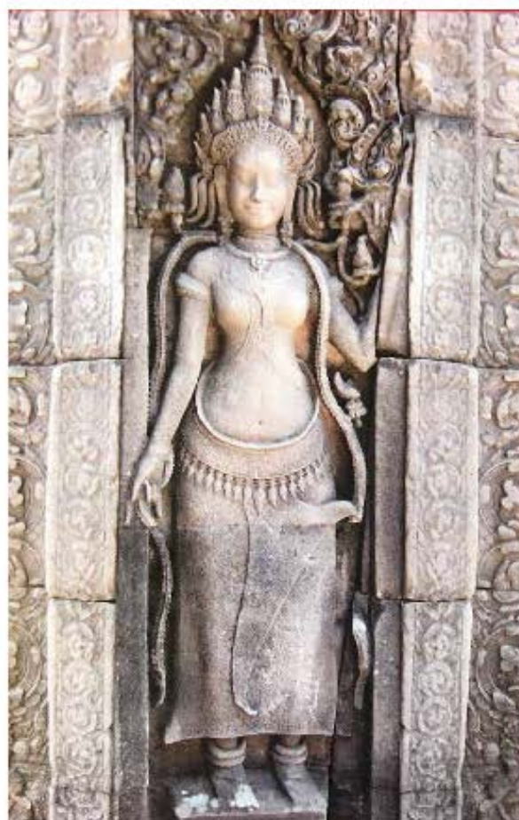
ចម្លាក់អប្សរានៅប្រាសាទបាយ័ន