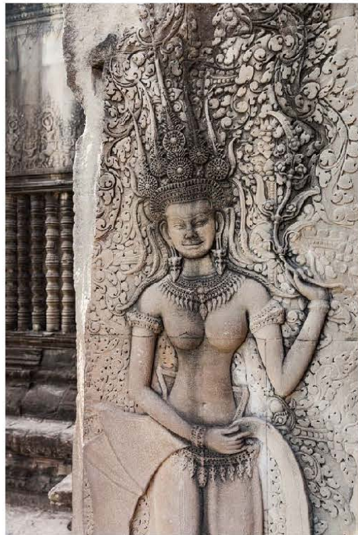
ចម្លាក់អប្សរានៅប្រាសាទអង្គរវត្ត