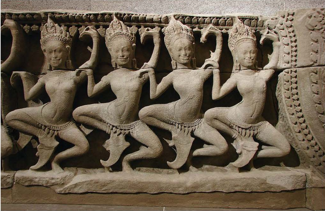
ចម្លាក់របាំអប្សរានៅប្រាសាទបាយ័ន