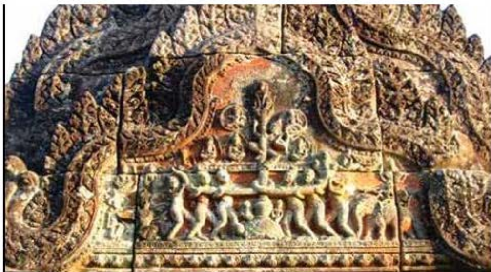
រូបនេះជាចម្លាក់ទាក់ទងនឹងរឿងអាណ្ណិកកុម្ម័រ ធ្លាក់នៅប្រាសាទព្រះវិហារ