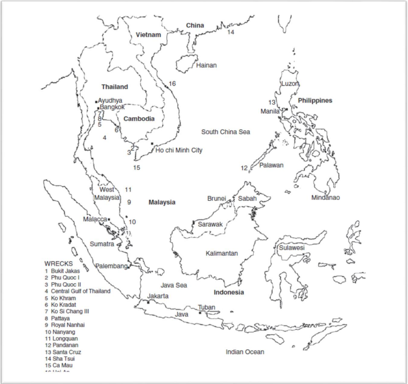
រូបលេខ២៖ ផែនទីបង្ហាញទីតាំងកប៉ាល់លិចនៅតំបន់អាស៊ីអាគ្នេយ៍រកឃើញនៅសតវត្សទី១២-១៦