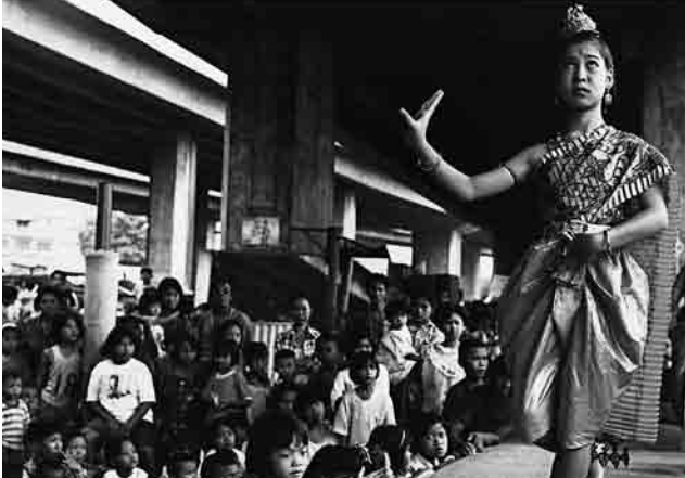
នៅអាស៊ីអាគ្នេយ៍ ប្រពៃណីចាស់ និងទម្លាប់ថ្មីសម័យទំនើប កំពុងប្រជែងគ្នាយ៉ាងរស់រវើក។

សវនាការបាញ់ផ្ដើមដោយឃ្លាមួយ ដែលបន្ថែម នឹងទៅឱ្យសេចក្ដីផ្ដើម ហើយវាបន្តដោយឃ្លាមួយ ទៀតនៅខាងចុងកថាខណ្ឌទីពីរ។ នៅមានជំនួយ សវនាការថែមទៀតនៅខាងចុងកថាខណ្ឌទីបី។ រីឯ កថាខណ្ឌទីបួន និងទីប្រាំ ក៏សុទ្ធតែជាសវនាការដែរ។