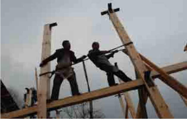
ភាពលម្អៀងរបស់អ្នកឯកទេស ពេលខ្លះក៏អាចទាញអ្នកឲ្យងាកខុសទិសដៅដែរ។