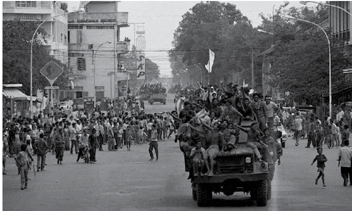
ពេលពួកខ្មែរក្រហមដណ្តើមបានអំណាច នាខែមេសា ឆ្នាំ១៩៧៥ វាបានបង្កនូវវិសាសកម្មដ៏សែនអាក្រក់ដល់ប្រទេសកម្ពុជា

តាំងពីឆ្នាំ ១៩៤៥ មក មានអ្នកសារព័ត៌មានជាង ៣២០ នាក់ បានស្លាប់ ឬបាត់ខ្លួនក្នុងសង្គ្រាម ជាច្រើននៅតំបន់ ឥណ្ឌូចិននេះ។ អង្គការ IMMF ត្រូវបានបង្កើតឡើងនៅទសវត្សរ៍ឆ្នាំ ១៩៩០ ដើម្បីឧទ្ទិសដល់វិញ្ញាណក្ខន្ធរបស់អ្នកក្លាហានទាំងនោះដោយរួមចំណែកក្នុងការអភិវឌ្ឍជំនាន់ថ្មីមួយនៃអ្នកសារព័ត៌មាននៅអាស៊ី-អាគ្នេយ៍។ ស្បៀរកៅមួយក្បាលនេះជាផលិតផលរូបិយមួយនៃគំនិតផ្តួចផ្តើមរបស់យើង។