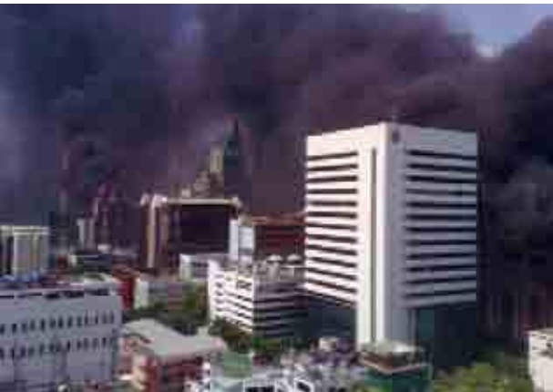
មនុស្សអាចបង្កការខូចខាតដល់បរិស្ថានតាមរបៀបច្រើនយ៉ាងណាស់។

ព្រឹកថ្ងៃអាទិត្យ ទី ៩ មេសា ប្រជាជនក្នុងទីក្រុងប៉េកាំង ក្រោកពី ដំណេកទៅទទួលទិដ្ឋភាពគួរឲ្យខ្លបខ្លាចមួយ គឺផ្ទៃមេឃប្រៃប្រណីទៅ ជាពណ៌លឿងចាស់ដូចសំបកក្រូចទុំ។