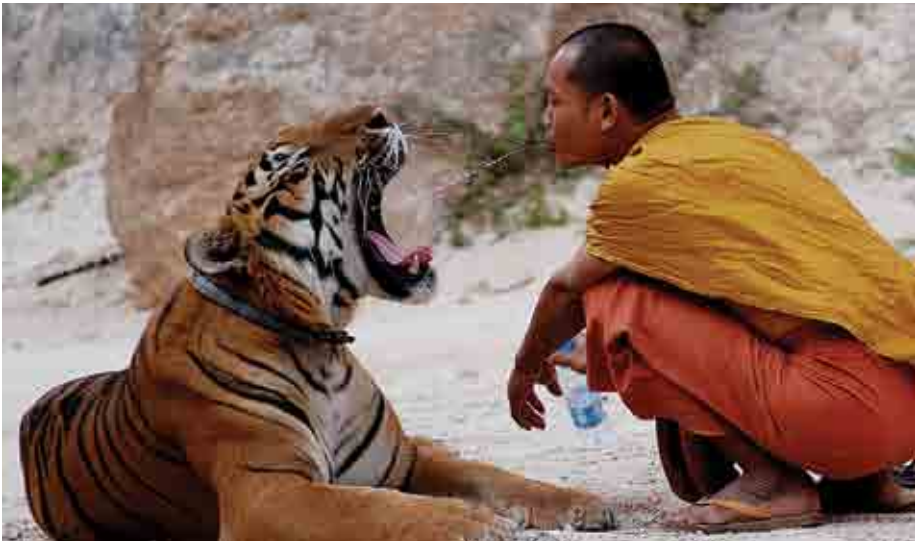
បើនៅតែក្នុងការិយាល័យ អ្នកនឹងមិនអាចរកបានប្រធានបទល្អៗយកមកសរសេរទេ។

ជាងការសរសេរក្រោមគំនិតស្តីអំពី " អត្ថន័យនៃជីវិត " ទៅទៀត។ ចូរពិភាក្សាគោលគំនិតនេះ ជាមួយនិពន្ធនាយក ឬជាមួយសហសេរីក្នុងទម្រង់ pitch ឬអាចនិយាយជាកាសាខ្មែរបានថាជាការ " ពពាយនាយ " ។ Pitch គឺជាការប៉ុនប៉ងបញ្ចុះបញ្ចូលនិពន្ធនាយកឲ្យ " ទិញ " គោលគំនិតរឿងរបស់អ្នកដែលវាជាសេចក្ដីសង្ខេបច្បាស់លាស់អំពីសំណួរ ឬគំនិតដែលអ្នកចង់ស្រាវជ្រាវធ្វើជាអត្ថបទ។ ការពពាយនាយនេះ ក៏គួរនិយាយអំពីរបៀបដូចម្ដេច (how) ដែលអ្នកនឹងសរសេរអត្ថបទនោះ មិនត្រឹមតែតើវានឹងនិយាយអំពី អ្វី (what) នោះទេ។ ក្នុងការពពាយនាយ អ្នកមិនបាច់សរសេរ ហើយអ្នកអាចបង្ហាញវាតាមការពន្យល់ផ្ទាល់មាត់ដល់និពន្ធនាយកក៏បានដែរ។ ប៉ុន្តែបើសរសេរ វាជាការប្រសើរជាប្រយោជន៍ឲ្យច្បាស់ទាំងអស់គ្នាថាតើអ្វីដែលអ្នកចង់សរសេរ។ ការពពាយនាយជាលាយលក្ខណ៍អក្សរគួរមានប្រហែល ៣០០ ពាក្យ ( ជាកាសាអង់គ្លេស )