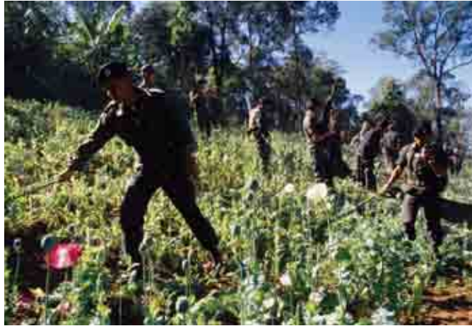
តើនេះជាការបង្ក្រាបត្រៀមមែនទេន ឬគ្រាន់តែជាការសម្តែងឲ្យល្អមើល?

អធិករណ៍ ដូចជាការការខ្វែង គំនិតគ្នាក្នុងរបបរកស៊ីដើម្បី កាត់ច្រើន រឿងក្តីក្តាំរដ្ឋប្បវេណី មិនចូលទៅដល់បន្ទប់សវនាការ ក្នុងតុលាការសម្រាប់កាត់ក្តីទេ តែវាត្រូវបានដោះស្រាយតាម រយៈពេលរបស់ភាគីរៀងៗ ខ្លួន ។ ក្នុងករណីដែលវា ត្រូវឡើងដល់តុលាការ ក្នុងពេលនេះ រដ្ឋមិនមែនជា ភាគីមួយក្នុងរឿងទៀតទេ តែគ្រាន់តែជាអ្នកផ្តល់វេទិកា មួយសម្រាប់ឲ្យមាន