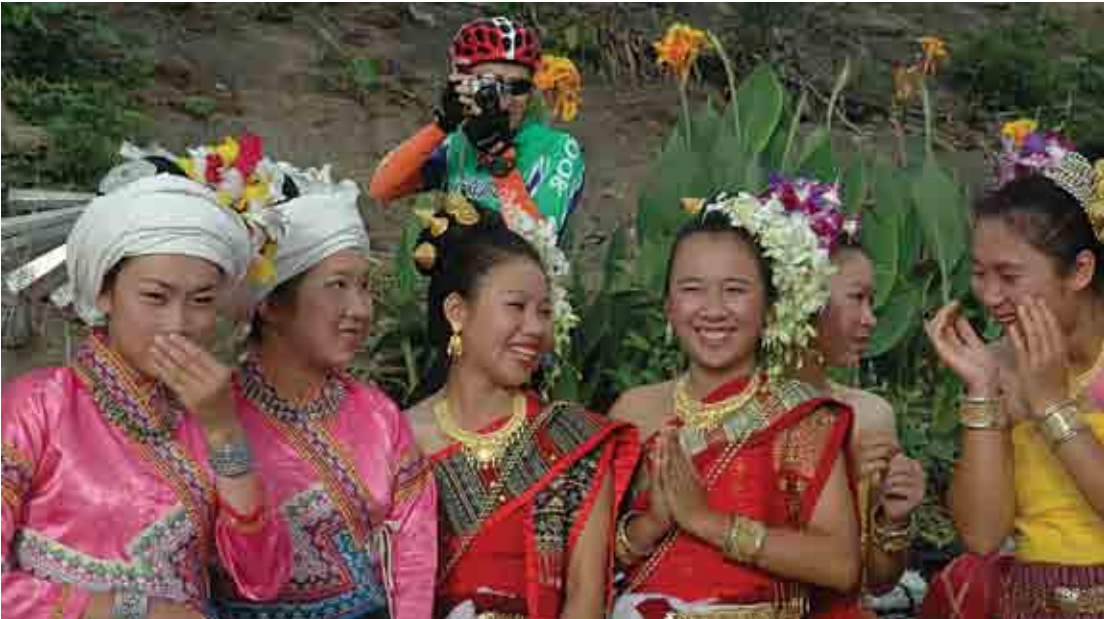
អ្នកសារព័ត៌មានត្រូវវាស់វែមទៅដល់កន្លែងហេតុការណ៍ ដើម្បីយកព័ត៌មាន។