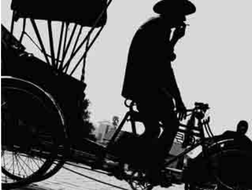
បើចង់ដឹងថាមនុស្សនៅតាមផ្លូវគិតដូចម្តេចខ្លះ សូមសាកសួរគេទៅ។

ផ្តល់ផងដែរនូវឱកាសយកមកគិតគូរនូវប្រតិកម្មថែមទៀតទៅនឹងព្រឹត្តិការណ៍ដំណឹង ក្នុងនោះមានសម្តីរបស់អ្នកដទៃ ដែលអ្នកមិនទាន់បានជជែកជាមួយ ឬន្តែអត្ថាធិប្បាយរបស់គេត្រូវលេចឡើងក្នុងសារព័ត៌មានផ្សេងរួចទៅហើយ។