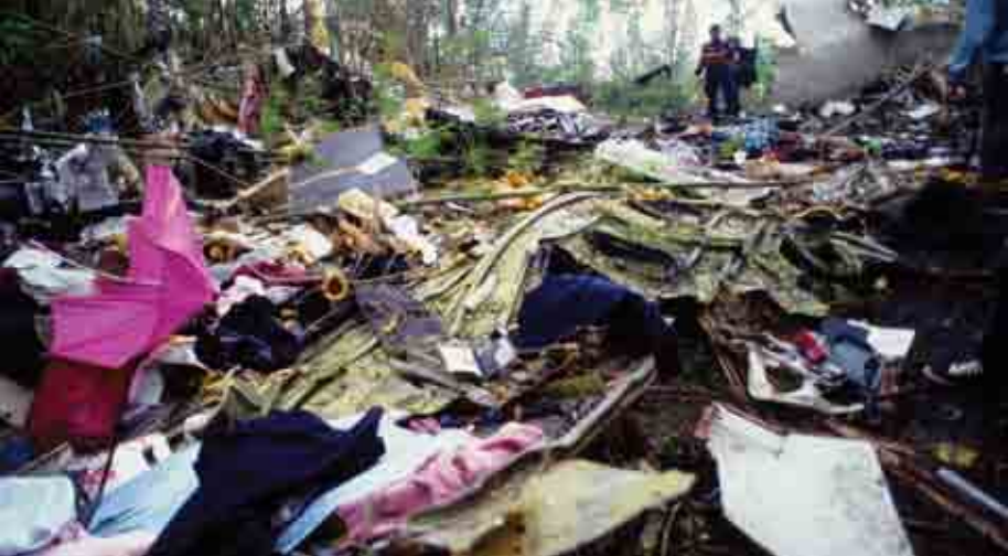
ការលុកលុយរីកកាយទឹកកន្លែងមហន្តរាយមួយ អាចធ្វើឲ្យវាក្លាយជាកន្លែងស៊ើបអង្កេតបទឧក្រិដ្ឋទៅវិញ ។

ឧប្បទ្វីបហេតុ និងគ្រោះមហន្តរាយ : គ្រោះ ឧប្បទ្វីបហេតុ គឺជាវត្ថុចាំបាច់ចិញ្ចឹមជីវិតសម្រាប់ អង្គការព័ត៌មានភាគច្រើនលើពិភពលោក ។ កាលណាឧប្បទ្វីបហេតុមានពាក់ព័ន្ធមនុស្សច្រើន ដូចជាគ្រោះថ្នាក់យន្តហោះ ឬថ្ងៃភ្លៀងជាដើម ឬក៏ ការរលំអគារ វាត្រូវជាគ្រោះមហន្តរាយហើយ ។ ជានិច្ចកាលជាអ្នកយកព័ត៌មាន អ្នកគួរប្រញាប់- ប្រញាល់ទៅឲ្យដល់កន្លែងកើតហេតុ ដើម្បីសាកសួរ នាំមនុស្ស ដែលជាសាក្សីហេតុការណ៍ ឬក៏បានរួច ជីវិតពីគ្រោះថ្នាក់នោះ ។ អ្នកក៏អាចសង្កេតមើលផ្ទាល់ ភ្នែកផងដែរ នូវអ្វីដែលទើបនឹងកើតឡើង ។ សម្លេង ក្លិន និងទិដ្ឋភាព ដែលអ្នកសង្កេតឃើញនឹង ផ្តល់នូវការពិពណ៌នាមានប្រយោជន៍ដល់អ្នកអាន ។