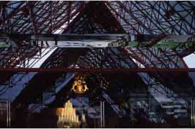
តើគម្រោងសាងសង់ល្បីឈ្មោះទាំងអស់ សុទ្ធតែបម្រើផលប្រយោជន៍ជាតិ ឬយ៉ាងណា ?

រឿងនយោបាយណាដែលអាចយកមកសរសេរបាននោះទេ ។ អ្នកស្រុកក្នុងមូលដ្ឋានអាចមានការភ្ញាក់ផ្អើល ឬក៏មានការមន្ទិលសង្ស័យផងនៅពេលដែលគេឃើញអ្នកសារព័ត៌មានដើររករឿងក្នុងតំបន់របស់គេយកមកសរសេរ ដូច្នោះអ្នកចាំបាច់ត្រូវកសាងឲ្យបាននូវការជឿទុកចិត្ត និងប្រកបទាក់ទងនៅក្នុងចំណោមពួកគេជាមុនសិន មុននឹងអ្នកចាប់ផ្តើមសរសេរអំពីពួកគេ ។