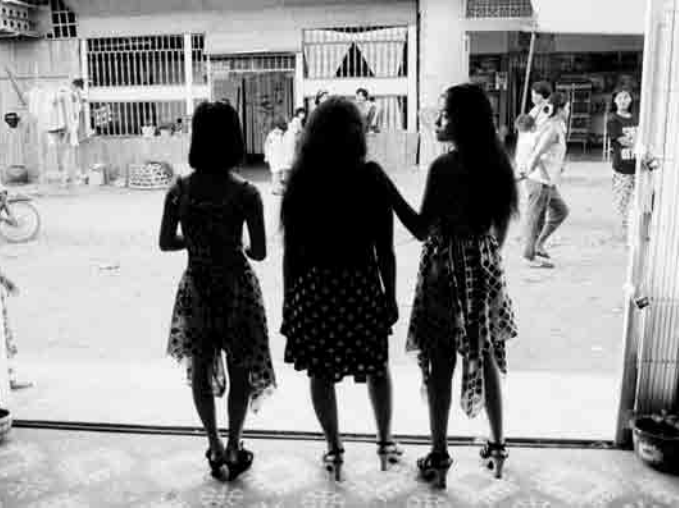
បើវាជាទង្វើមិនស្របច្បាប់ តើពួកគេជាឧក្រិដ្ឋជន ឬជាជនងងឹតខ្លះ?

កំហុស។ បន្ទាប់ពីនោះគេនឹងពិនិត្យមើលយ៉ាងល្អិតល្អន់នូវភស្តុតាងក្នុងការជំរះក្តី។ គេធ្វើរបៀបនេះដោយមានសាក្សីអង្គុយទល់មុខភាគីទាំងអស់ក្នុងសវនាការ។ ភាគីអយ្យការសួរសំណួរទៅកាន់សាក្សី ហើយឲ្យគេបង្ហាញអត្តសញ្ញាណវត្ថុតាំងដែលតាំងក្នុងសវនាការ។ មកដល់ដំណាក់កាលនេះ (គេហៅវាថា ការសាកសួរសំណួរ/examination-in-chief) ចម្លើយជួយបញ្ជាក់បន្ថែមទៅនឹងភស្តុតាង