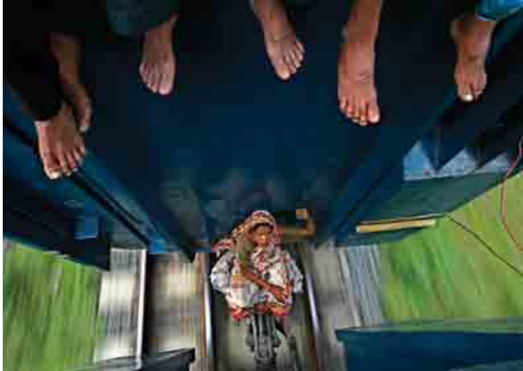
ដើម្បីរស់ មនុស្សត្រូវបង្ខំចិត្តទៅរកបរិយ័ត្នជីវិតនៅទីកន្លែងឆ្ងាយពេញដោយការលំបាក ។

ការជ្រើសតាំងលោក អាប៊ីសិត វេជ្ជបណ្ឌិត (Abhisit Vejjajiva) ជាការសំគាល់ថានេះជាលើក