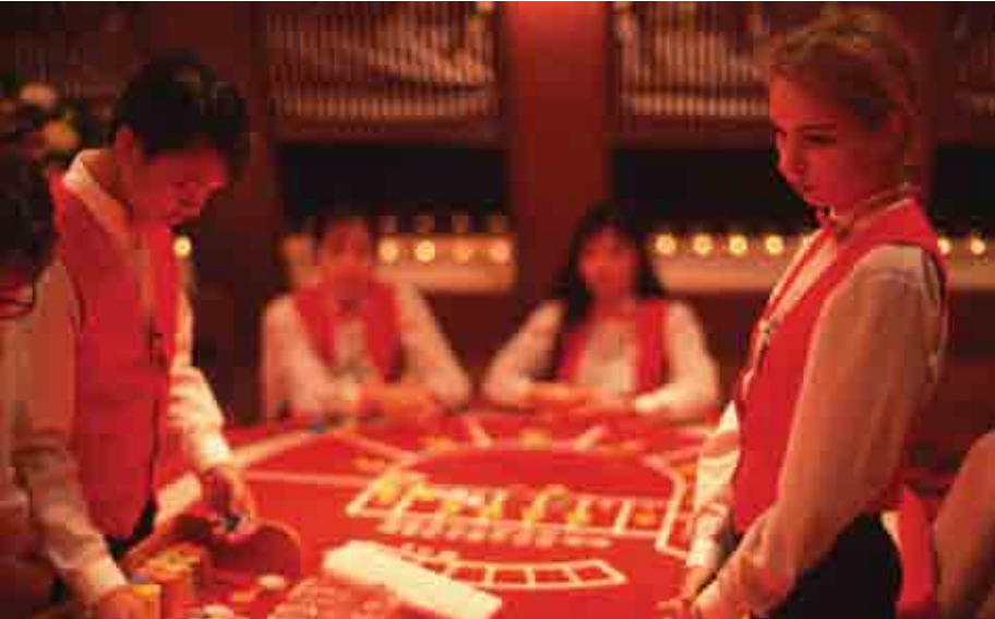
គូលេខតែងជួយយើងក្នុងការសេញដំណើរគិតអំពីស្ថានភាពនៃបញ្ហាមួយ។