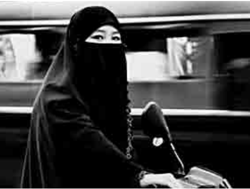
ចូរកុំភ្លេចសង្កេតមើលអ្វីៗដែលកំពុងកើតឡើងនៅជុំវិញខ្លួនរបស់អ្នក។

មានលក្ខណៈប្រកបដោយថាមពលគ្រប់គ្រាន់ដើម្បីធ្វើឲ្យអ្នកអានដក់ចិត្តចាំសាប់រឿងដូចគ្នានឹង intro មួយមានថាមពល និងគួរឲ្យចាប់អារម្មណ៍ធ្វើឲ្យអ្នកអានដក់ចិត្តត្រូវតែម្តង។ ដូច្នេះចូរចងចាំចំណុចនេះពេលណាអ្នកប្រមូលព័ត៌មានយកមកសរសេរ។