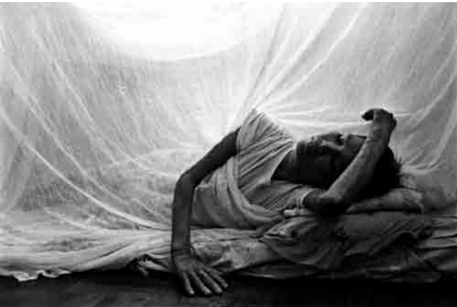
គេពិបាកប្រមាណណាស់នូវតម្លៃពិតប្រាកដដែលត្រូវបង់ បើគេព្រងើយកន្តើយ ការថែទាំផ្នែកវេជ្ជសាស្ត្រពេលមានជំងឺធ្ងន់ឡើង។

៨. ផ្តល់បរិបទ។ គ្រប់រឿងទាំងអស់ ចូរអង្វេង ផ្អែកទៅក្រោយ ហើយសួរខ្លួនឯងថា តើអ្នក អាសត្រូវដឹងអ្វីទៀត ដើម្បីយល់រឿងឲ្យបាន កាន់តែប្រសើរថែមទៀត? ព័ត៌មានថែម ទៀតពីក្រុមហ៊ុន? ព័ត៌មានថែមទៀតអំពី ទីផ្សារ? ព័ត៌មានថែមទៀតអំពីស្ថានភាព សេដ្ឋកិច្ច? ព័ត៌មានថែមទៀតអំពីមនុស្ស ពាក់ព័ន្ធ?