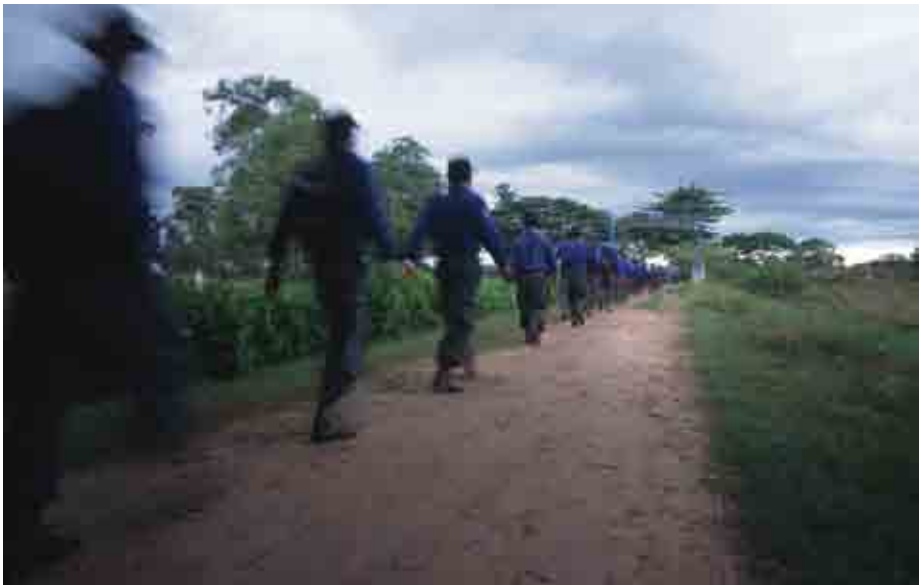
ការតទល់នឹងផ្លូវច្បាប់ ជាភាពប្រឈមធំមួយសម្រាប់អ្នកសារព័ត៌មាន ។

ក្សត្រ ព្រះអគ្គមហេសី ព្រះរាជបុត្រស្នងរាជ ឬព្រះរាជានុសិទ្ធិ នឹងត្រូវទទួលទណ្ឌកម្ម ដាក់ពន្ធនាគារក្នុងរយៈពេលពី ៣ ទៅ ១៥ ឆ្នាំ" ។ នៅប្រទេសកម្ពុជា មាត្រាទី ៧ នៃរដ្ឋធម្មនុញ្ញចែងថា " អង្គព្រះមហាក្សត្រ មិនអាចនរណារំលោភបំពានបានឡើយ" ។ បន្ថែមពីលើនេះ មាត្រាទី ១៣ នៃច្បាប់ស្តី ពីបេសសារព័ត៌មានឆ្នាំ ១៩៩៥ ហាមអ្នក សារព័ត៌មានមិនឲ្យ " ចុះផ្សាយ ឬចុះផ្សាយ ឡើងវិញនូវព័ត៌មាន ដែលបន្តៈបង្កាប ឬ មាក់ងាយស្លាប់នជាតិ" ។ ស្ថាប័នជាតិនេះ រួមមាន ស្ថាប័នព្រះមហាក្សត្រផងដែរ ។ វា ពិបាកណាស់សម្រាប់អ្នកសារព័ត៌មានដឹង បានថា ពេលណាច្បាប់នេះត្រូវបានយក មកប្រើចំពោះអ្នកសារព័ត៌មាន ។ នៅ ប្រទេសថៃមានការពិភាក្សាច្រើនអំពីច្បាប់