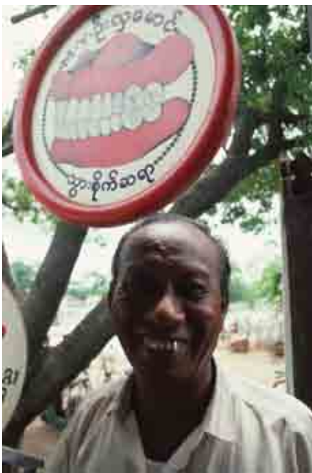
ការដឹកធ្មេញនៅក្រុងម៉ាន់ដាឡាយ អាចធ្វើបានយ៉ាងហោចស្រាល និងមិនសូវច្របាច់ ដូចការផលិតសៀវភៅមនុស្សកិច្ចាជីវៈសារព័ត៌មានទេ ។