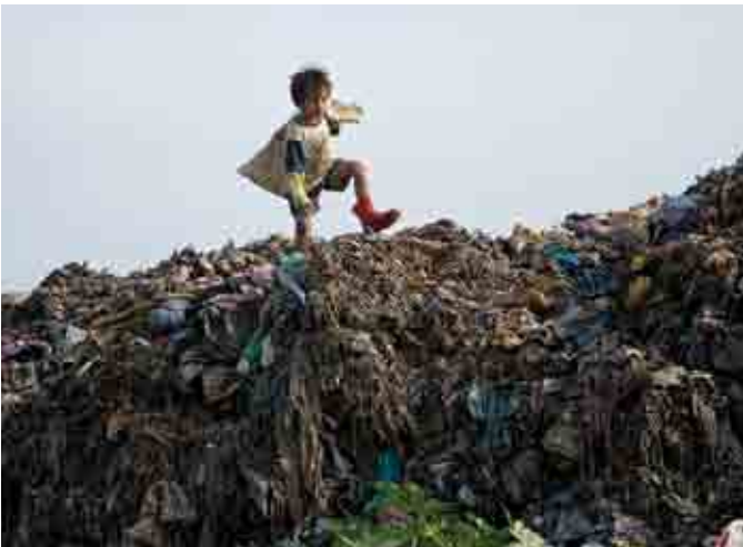
របៀបរស់នៅរបស់យើងដែលសំបូរដោយសម្រាម អាចគំរាមដល់ការរស់នៅរបស់ មនុស្សជំនាន់ក្រោយទៀត។

ឧទាហរណ៍ផ្សេងទៀតមាន កញ្ចប់អ្នកកើតជំងឺ មហារីកដុំសាប (cancer clusters) ដែលនិយមន័យ ដំដៅលើក្រុមមនុស្សនៅតំបន់ភូមិសាស្ត្រណាមួយ ដែលមានកើតជំងឺដុំសាបមហារីកប្រហាក់ប្រហែលគ្នា ដោយសារសារធាតុគីមី សារធាតុបំពុល ឬវិទ្យុសកម្ម ក្នុងបរិស្ថាន។ អ្នកសារព័ត៌មានចាំបាច់ត្រូវតែយល់ អំពី ខ្សែសង្វាក់ព្រឹត្តិការណ៍ និងទំនាក់ទំនងរវាង មនុស្ស និងបរិស្ថាន។ ការវិវត្ត និងដំណើរការ ឧស្សាហកម្ម តែងបណ្ដាលឲ្យមាននូវផលវិបាកធ្ងន់ធ្ងរ ដែលគេអាចមើលដឹងក្នុងរយៈពេលមួយយូរប៉ុណ្ណោះ។ ពេលខ្លះ ក៏វា មិនប្រាកដប្រជា ដែរ។ វាតែងតែ ពិបាកក្នុងការរកឲ្យមុខគំណរវាង មូលហេតុ និង