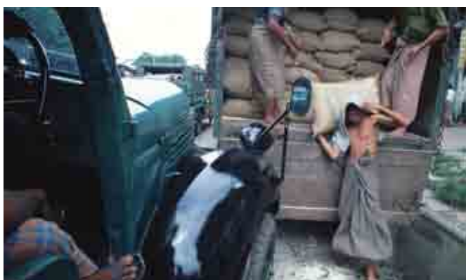
ការរៀបចំចាន់ចែងវិស័យកសិកម្មមានឥទ្ធិពលដោយផ្ទាល់លើវិបុលភាពជាតិ ។

សយោបាយអភិវឌ្ឍន៍ : នេះសំដៅលើវិធានមគ្គុទេសក៍ប្រកាសជាផ្លូវការ ដែលបង្ហាញពីគោលបំណងរដ្ឋាភិបាលចង់ឲ្យសេដ្ឋកិច្ចវិវត្តន៍របៀបណា ។ ពេលខ្លះគេឲ្យឈ្មោះ ដូចជាជារៀតណាមថា doi moi (renovation) ។ វាក៏អាចជាមគ្គុទេសក៍