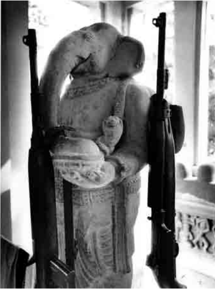
សង្គមមួយអាចសម្បូរអាវុធ តែមិនមែនបានន័យថា វាមានរបៀប រៀបរយទាំងស្រុងនោះទេ ។

ហេតុដូច្នេះហើយបានជាវាមានសារៈសំខាន់ណាស់ ដែលអ្នកសារព័ត៌មានត្រូវតែចេញក្រៅរដ្ឋជាតិក្នុង ពេលបោះឆ្នោត។ នៅប្រទេសកម្ពុជា គណបក្សកាន់ អំណាចបានធ្វើ ការបោះឆ្នោតសាកល្បងក្លែងក្លាយ (mock elections) នៅខេត្តបាត់ដំបង មុននឹងការ បោះឆ្នោតជាតិជាផ្លូវការមកដល់។ អ្នកបោះឆ្នោត ត្រូវបានគេបង្ហាញអំពីរបៀបបោះឆ្នោត "ត្រឹមត្រូវ" ដោយគូសសញ្ញាក្នុងប្រអប់ក្បែរនិមិត្តសញ្ញា គណបក្ស។ នៅខេត្តដទៃទៀត អ្នកបោះឆ្នោតត្រូវ បានគេបង្ខំឱ្យផ្តិតមេដៃសន្យារក្សាក្តីភាពជាមួយ គណបក្ស។ ខាងក្រោមនេះជាសេចក្តីផ្តើមនៃរឿង មួយបែបនេះរបស់ការសែត The Cambodia Daily ៖