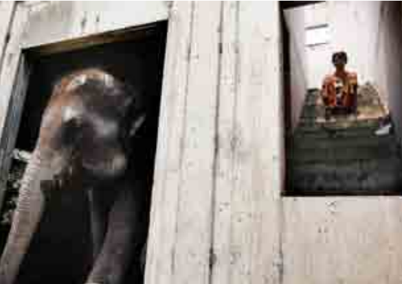
កុំភ្លេចប្រាប់ផង បើមានជំងឺនៅក្នុងបន្ទប់។

សារព័ត៌មានដែលមានកេរ្តិ៍ឈ្មោះបោះសម្លេង គួយដាក់កាសែត The New York Times និង ទស្សនាវដ្តី The Economist ជាដើម បច្ចុប្បន្ននេះ ក៏គេផលិតរឿងជាអូឌីយ៉ូដែរ ដែលគេអាចទាញយក/ ដោនឡូត (download) ដាក់ក្នុង MP3 player សម្រាប់ស្តាប់ក្នុងពេលធ្វើដំណើរតាមរថយន្ត ឬក្នុង ពេលរត់ហាត់ប្រាណជាដើម។