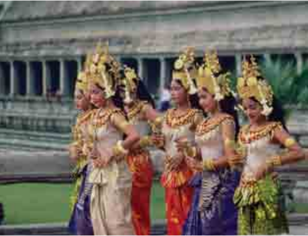
ប្រទេសក្រីក្រតែងប្រើប្រាស់វិស័យទេសចរណ៍ ដើម្បីរកចំណូលរូបិយប័ណ្ណប្រទេសពីបណ្តាប្រទេសអ្នកមាន ។

(ដោយគ្មានវត្ថុមានអីទង់ដែងក្នុងពេលនោះទេ) នៅលើទីផ្សារវត្ថុធាតុដើមនៅក្រុងឡុងដ៍ ឈីកាហ្គោ ញូវយ៉ក និងសៀងហៃ ដែលទាំងនេះសុទ្ធតែជាផ្សារហិរញ្ញវត្ថុធំៗលើពិភពលោក ។ ភាគច្រើន ការដួញដូរវត្ថុធាតុដើម ត្រូវបានធ្វើលើគោលការណ៍ កំរក់ទុកជាមុន (forward basis) គេព្រមព្រៀងកិច្ចសន្យាថានឹងបញ្ជូនទំនិញទៅឲ្យអ្នកទិញនៅថ្ងៃណាមួយនាអនាគត ក្នុងតម្លៃមួយដែលគេបានឯកភាពគ្នារួចហើយក្នុងពេលចុះកុងត្រា ។