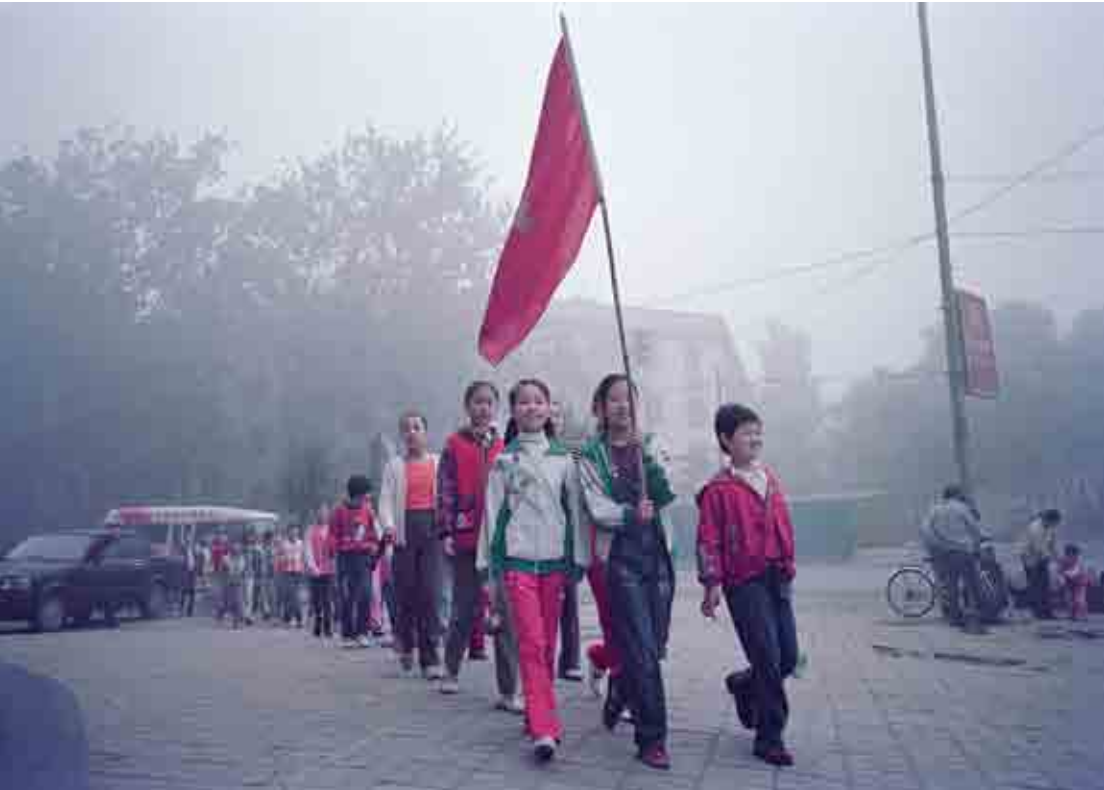
តើនេះជារូបសកម្មភាពនយោបាយ ឬជារូបអំពីការបំពុលបរិយាកាស?