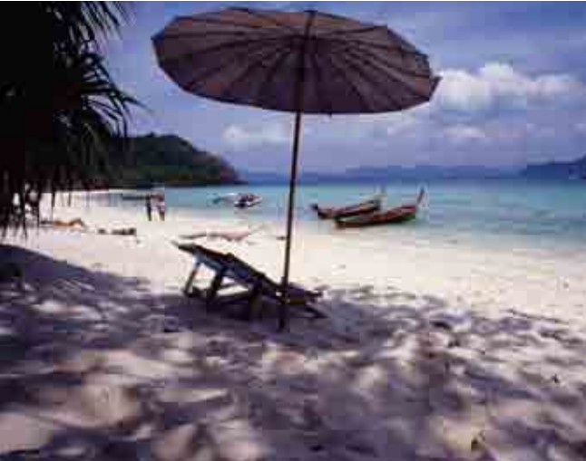
តើទីនេះមានបរិស្ថានស្ថិតបរិស្ថេទ ឬត្រូវបានបំពុលដោយទេសចរណ៍អស់ហើយ?

ពាក្យថា "បរិស្ថាន" មានមួយផ្នែក គឺ "បរិស្ថានបង្កើតដោយមនុស្ស" (man-made environment) មានលំនៅដ្ឋានសាលារៀន របៀបរុក រោងចក្រ និងមួយផ្នែកទៀត គឺ "បរិស្ថានធម្មជាតិ" (natural environment) ដែលក្នុងនោះមាន ខ្យល់ដី ទឹក ដើមឈើ រុក្ខជាតិ សត្វ និងធនធានវិវា ។ និយាយយ៉ាងខ្លីបរិស្ថាន គឺអ្វីៗគ្រប់យ៉ាងនៅជុំវិញខ្លួនយើង ហើយយើងជាផ្នែកមួយរបស់វាដែរ ។