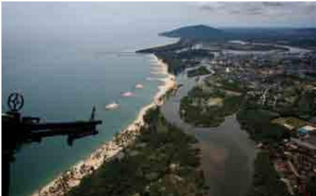
កន្លែងស្រស់ប្រិមប្រិយមួយចំនួននៅលើកំពែងដីយើងនេះ ក៏ប្រទះនឹងបញ្ហាច្រើនណាស់ដែរ ។

ក្នុងមួយឆ្នាំក្នុងអំឡុងទសវត្សរ៍ឆ្នាំ ១៩៩០ មកនៅត្រឹម ១.២០០ នាក់ ក្នុងមួយឆ្នាំក្នុងរយៈពេលបីឆ្នាំចុងក្រោយនេះ ។ រីឯការដាក់ទណ្ឌកម្មវិញ ក៏កាន់តែមានសភាពស្រាលជាងមុនដែរ ។ កាលពីឆ្នាំមុន ក្នុងចំណោមមនុស្ស ១.២១៩ នាក់ ដែលទទួលការចោទ ប្រកាន់ពីបទផិតមានតែ ៤៧ នាក់ប៉ុណ្ណោះ ដែលត្រូវជាប់ពន្ធនាគារ ប្រៀបធៀបនឹង ៣៩៣ នាក់ ក្នុងចំណោមជនជាប់ចោទ ១.៩០២ នាក់ នៅឆ្នាំ ២០០១ ។ ភាគច្រើនបានត្រឹមតែជាប់ទោសព្យួរ ឬមួយក៏រួចខ្លួន ដោយសារប្តី ឬប្រពន្ធដកពាក្យបណ្តឹងវិញ ។ អ្នកខ្លះក៏មើលឃើញដែរថា វាជារឿងមិនសមហេតុផល ដែលកូរ៉េ ខាងត្បូងចាត់ការផិតជាអំពើឧក្រិដ្ឋ នៅពេលដែលគេគ្មានច្បាប់ណាមួយ សម្រាប់ចាត់ការជាមួយស្នងការជាមួយសាច់ញាតិដងផងនោះ ។