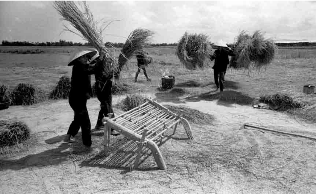
ការងាររបស់អ្នកសារព័ត៌មានបានវិវត្តន៍រស់រវើកជានិច្ចក្នុងតំបន់មួយ ដែលមានការប្រែប្រួលយ៉ាងសម្បើមក្នុងមួយជំនាន់មនុស្សកន្លងមកនេះ។