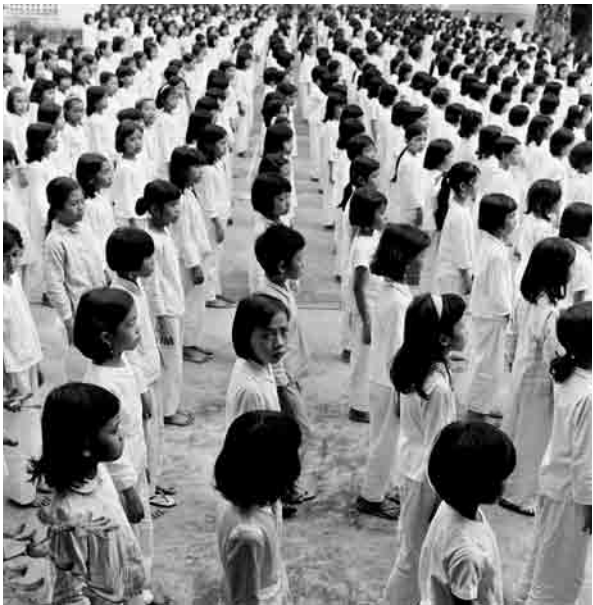
តើអ្វីដែលធ្វើឲ្យនរណាម្នាក់លេចធ្លោក្នុងចំណោមអ្នកឯទៀត?

គាត់និយាយថា រដ្ឋាភិបាលគួរលើកទឹកចិត្តអង្គការមិនមែន រដ្ឋាភិបាលឲ្យមានការពាក់ព័ន្ធកាន់តែច្រើនឡើងជាមួយមនុស្សចាស់ ព្រោះថា ពួកគេមានសក្តានុពលជាសមាជិកប្រកបដោយផលិតភាព មានប្រយោជន៍ដល់សង្គម ។