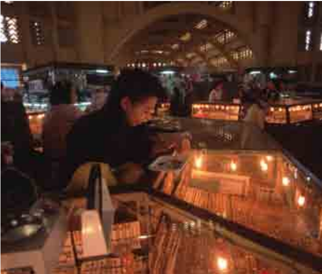
ពាណិជ្ជកម្មប្រកបរបរចិញ្ចឹមជីវិតតាមរយៈការយល់អំពីលេខ ។

បើអ្នកឃើញថាលេខតំណាងឲ្យអ្វីម្យ៉ាង អ្នកពិតជាមិនសូវមានអារម្មណ៍មួយឯងជាមួយវាប៉ុន្មានទេ ។ ប្រសិនបើអ្នកកំពុងព្យាយាមសរសេររឿងមួយអំពីកម្មករ ១០០ នាក់ ដែលត្រូវបានគេបញ្ឈប់ពីការងារនៅរោងចក្រស្បែកជើង ABC Shoe Company អ្នកពិតជាមិនសប្បាយក្នុងការសរសេរទេ បើសិនជាអ្នកត្រូវសរសេរបង្ហាញឈ្មោះនីមួយៗរបស់កម្មករទាំងអស់នោះ ។ លេខ ១០០ គឺតំណាងឲ្យបុគ្គលទាំងអស់នោះ ។