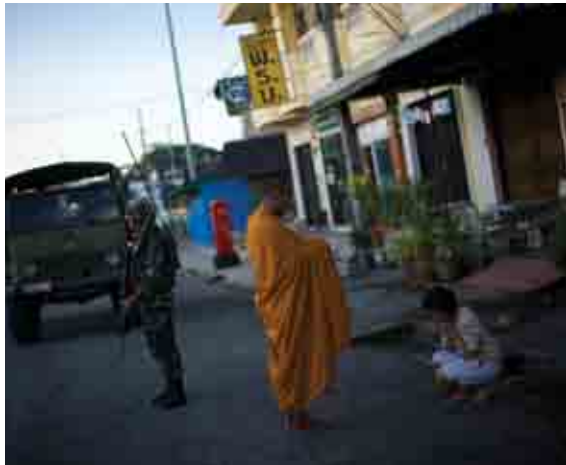
ចង្វាក់ជីវិតប្រចាំថ្ងៃមានសភាពខុសគ្នាពីកន្លែងមួយទៅកន្លែងមួយ។

ពិតណាស់ មនុស្សខ្លះមិនសប្បាយចិត្តនឹងអាស ថាប្រទេសថៃជាប្រជាជាតិ គួរឲ្យ #s@@!! ភ័យ ខ្លាច។ តែវាមិនមែនជាក់ហុសរបស់ខ្ញុំទេ។ អាចថា អ្នកគាំទ្រខ្ញុំ គាត់ស្រវឹងពេលដែលគេនិយាយទៅកាន់ ជនបរទេសថា លើកលែងរូបខ្ញុំម្នាក់ចេញអ្វីៗនៅ ប្រទេសថៃដូចជាមិនសូវល្អប៉ុន្មានទេ។ ហើយគួរឲ្យ ភ្ញាក់ផ្អើល ពួកបរទេសទាំងនោះជឿ។ ខ្ញុំមិនដែល គិតថា ពួកបរទេសងាយនឹងជឿដូច្នោះសោះ។