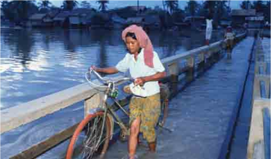
រោងចក្រសម្ព័ន្ធទ្រុកទ្រោមអាចបង្កគ្រោះថ្នាក់ដល់សាធារណជន។

ទង្វើបែបនេះរំលោភទៅលើសេចក្តីណែនាំក្នុងច្បាប់បោះឆ្នោត។