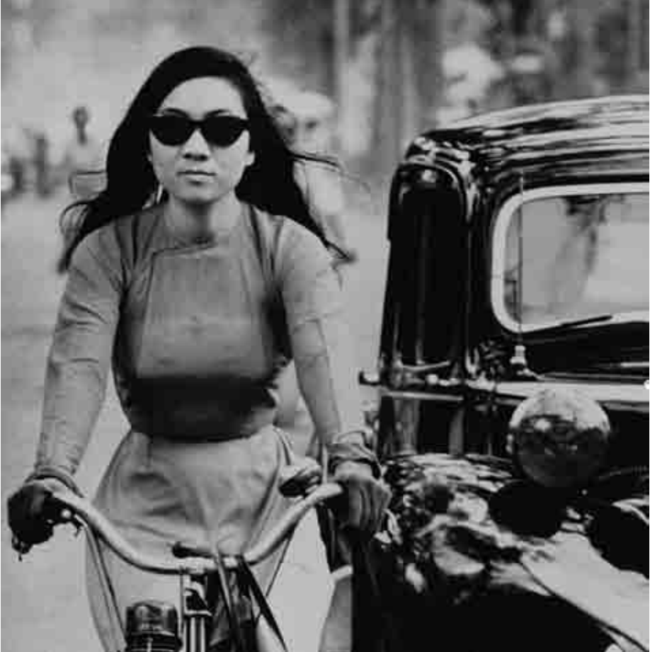
ការងាររបស់អ្នកសារព័ត៌មាន គឺធ្វើការបកស្រាយរឿងរ៉ាវស្មុគស្មាញឲ្យបានត្រឹមត្រូវ និងច្បាស់លាស់ ដើម្បីឲ្យអ្នកអាន និងទស្សនិកជនយល់។