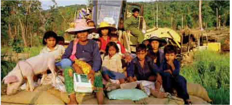
ការរៀបរាប់ពិពណ៌នាជាមធ្យោបាយល្អមួយក្នុងការរក្សាចំណាប់អារម្មណ៍អ្នកអាន ។

អ្នកយកព័ត៌មានគួររូបភាព ដោយមានសេចក្តីពិស្តារ ដូចជា៖ មនុស្សរស់នៅ ក្រោមធាងដូង និងប្រើសំបក កំប៉ុងត្រងទឹកភ្លៀង ។