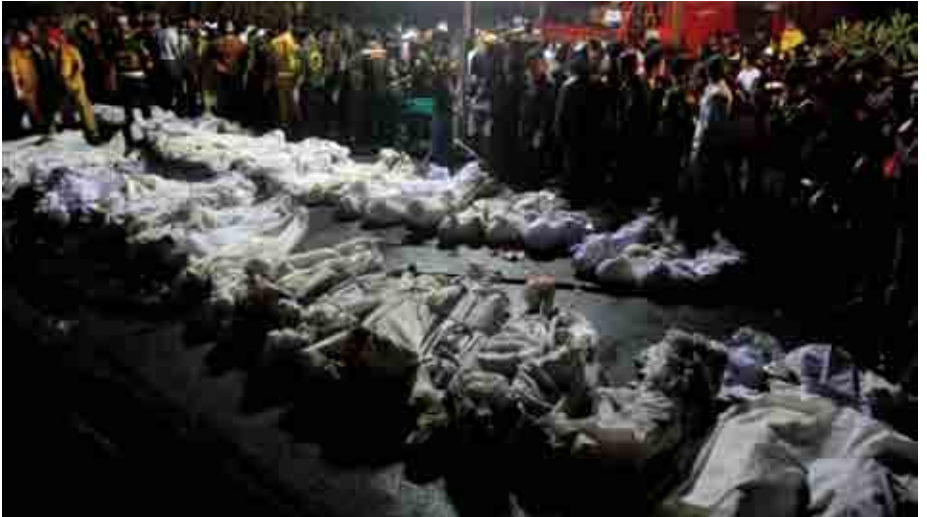
តើរបស់ព័ត៌មានរស់បានដោយសារតែគ្រោះមហន្តរាយ ឬក៏វាជួយធ្វើឲ្យមហន្តរាយថយចុះជាងមុន ?

គេហដ្ឋានរបស់គាត់នៅក្រុងមូនីក ប្រទេសអាល្លឺម៉ង់ រោងឡើងនៅព្រឹកមួយកាលពីពីរឆ្នាំមុន ។