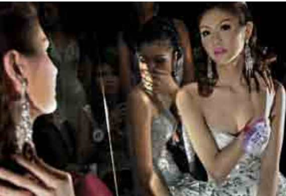
តើមានអ្វីពិសេសអំពីបុគ្គលជាកម្មវត្ថុនៃរឿងរបស់អ្នក?

ពេលវាមានអាយុមួយឆ្នាំ ស្ថានភាពរបស់វាក៏ចុះដុនជាប់ដែរ។ វា នៅដេកទ្រឹងមួយកន្លែង នៅពេលដែលទារកដទៃតែងតែរុញប្រហែលគ្នានេះដែរ ចាប់