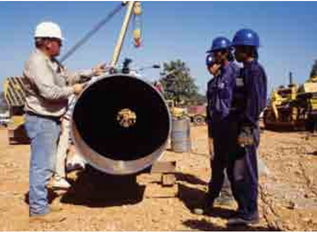
ដោយសារបញ្ជាក់ខ្សែ គេអាចទាញយកធនធានមានតម្លៃមកប្រើប្រាស់ ប៉ុន្តែក៏ក្នុង តម្លៃមួយខ្ពស់ដែរ។